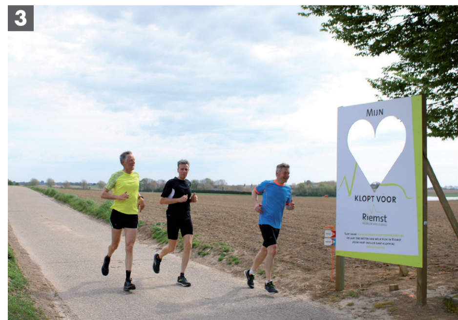
Samen werken aan de conditie tijdens de lentejogging.