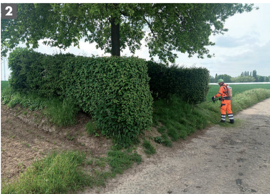
De technische dienst voert voortdurend groenonderhoud uit.