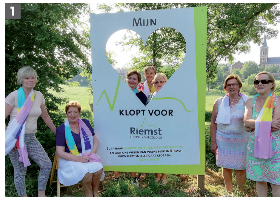
Inwoners laten zien dat hun hart voor Riemst klopt.

Een leuke foto gemaakt in Riemst? Zend je beeld naar communicatie@riemst.be en misschien zie je jouw foto terug in de volgende 37zeventig.