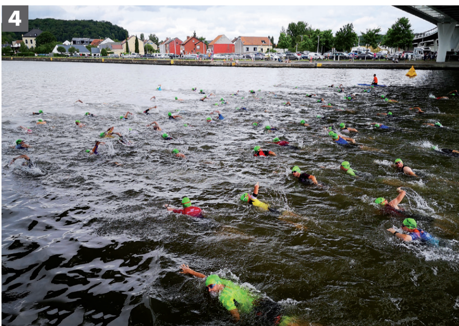
Tijdens de Cave Triathlon in Kanne werd er gezwommen in het Albertkanaal.